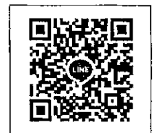
QR-Code เพื่อสมัครอบรม